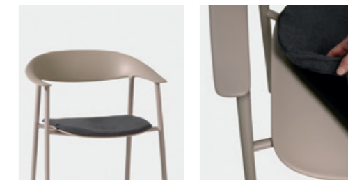
– Removable upholstered seat cushion Cojín de asiento desenfundable