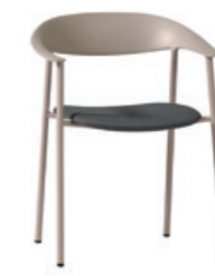
– Armchair with upholstered seat Sillón con asiento tapizado