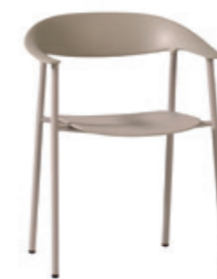
– Armchair Sillón